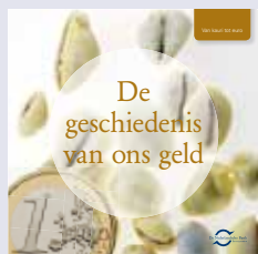
'De geschiedenis van ons geld'