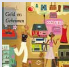
'Goud, Geld en Geheimen' publieksbrochure