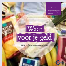
'Waar voor je geld' praktische lesopdrachten tweede fase havo/vwo