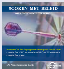
'Scoren met beleid' digitaal lesprogramma tweede fase havo/vwo

Onder meer de volgende uitgaven van de Nederlandsche Bank zijn verkrijgbaar: