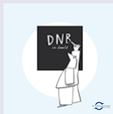
'DNB in beeld'