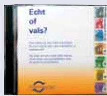
'Echt of vals?' cd-rom met de echt- heidskenmerken van de eurobiljetten